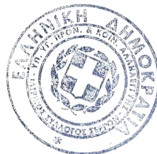
Δρ Άγγελος Βάκαλος Ωτορινολαρυγγολόγος